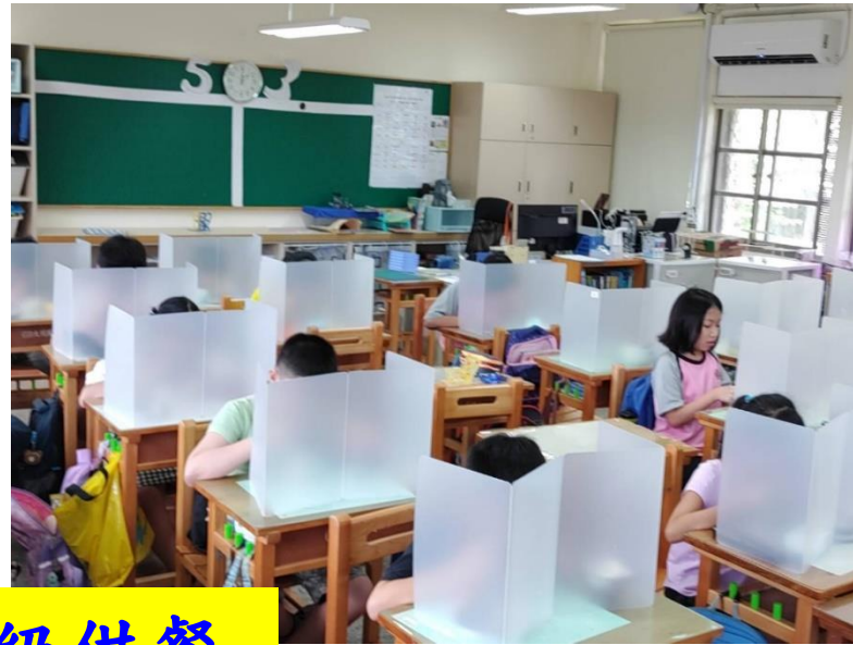
防疫期間班級供餐